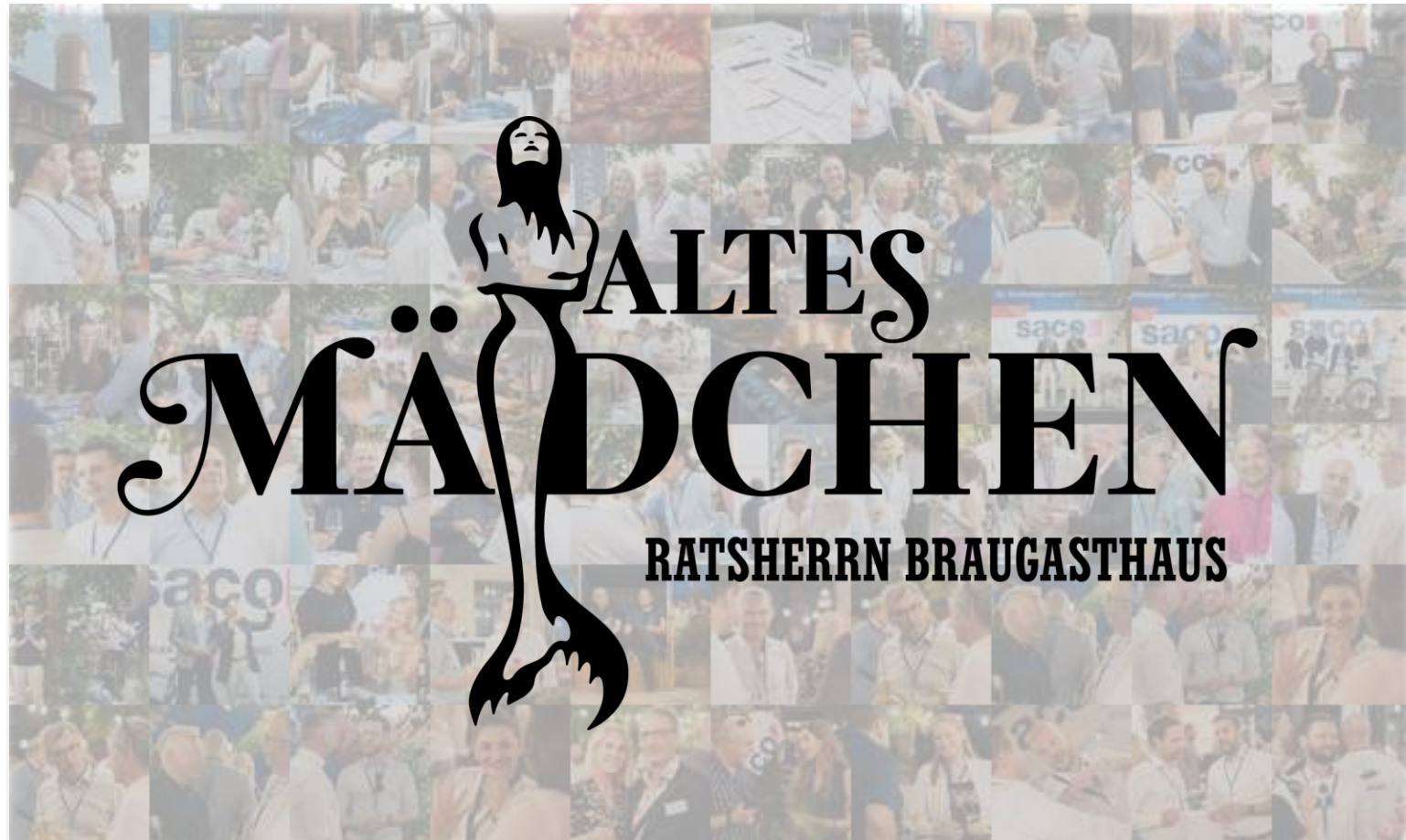
Logo @Altes Mädchen